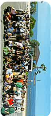
城崎マリンワールドの旅