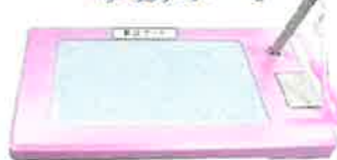
筆談具 筆談ボード