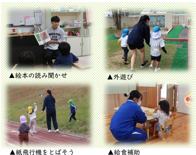
▲絵本の読み聞かせ