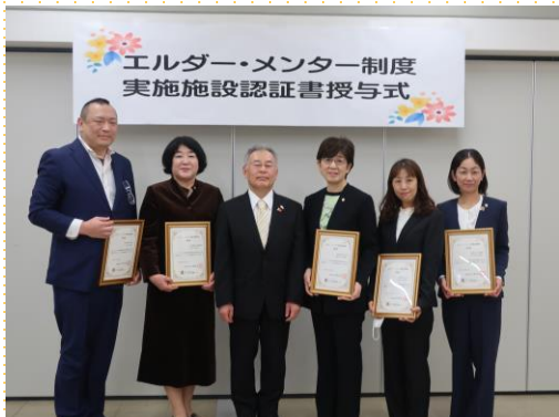
▲亀井副知事と代表者の皆様